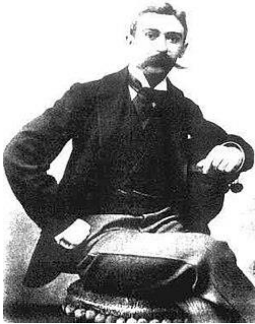
Πιέρ ντε Κουμπερτέν

Λίγο αργότερα, ο βαρώνος Πιέρ ντε Κουμπερτέν, ο οποίος ήταν Γενικός Γραμματέας των γαλλικών αθλητικών σωματείων, προσπαθούσε να δικαιολογήσει την ήττα των Γάλλων στον Γαλλοπρωσικό πόλεμο (1870-1871). Πίστευε ότι ο λόγος της ήττας ήταν επειδή οι Γάλλοι δεν είχαν αρκετή φυσική διαπαιδαγώγηση και ήθελε να τη βελτιώσει. Ο Κουμπερτέν ήθελε επίσης να ενώσει της εθνότητες και να φέρει μαζί τη νεολαία με τον αθλητισμό, παρά να γίνονται πόλεμοι. Πίστευε ότι η αναβίωση των Ολυμπιακών Αγώνων θα πετύχαινε και τους δύο πιο πάνω σκοπούς του.