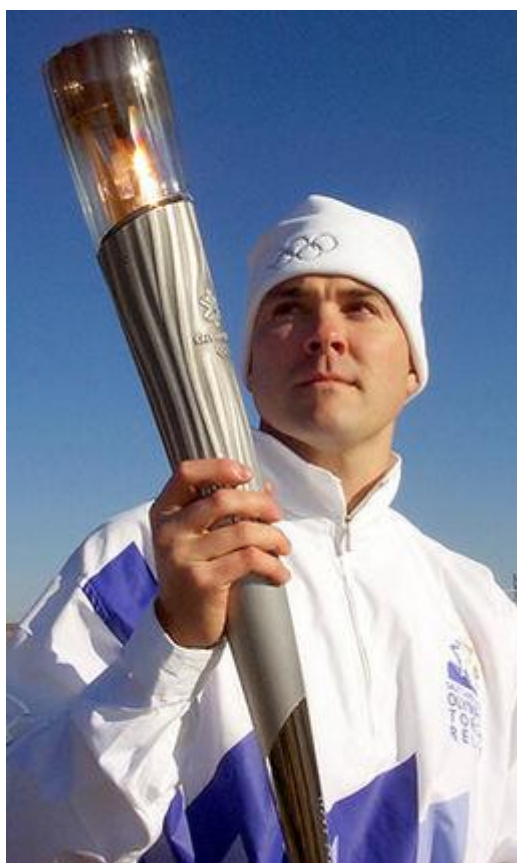
Δρομέας μεταφέρει την Ολυμπιακή φλόγα

Μέχρι το 1992, οι Χειμερινοί Ολυμπιακοί Αγώνες διεξάγονταν την ίδια χρονιά με τους Θερινούς. Αλλά το 1993 η ΔΟΕ αποφάσισε οι Χειμερινοί Ολυμπιακοί να γίνονται κάθε τέσσερα χρόνια δύο χρόνια μετά τους Θερινούς. Έτσι οι επόμενοι Χειμερινοί Ολυμπιακοί Αγώνες έγιναν το 1994 κι είχαν απόσταση δύο χρόνων μόνο απ' τους προηγούμενους.