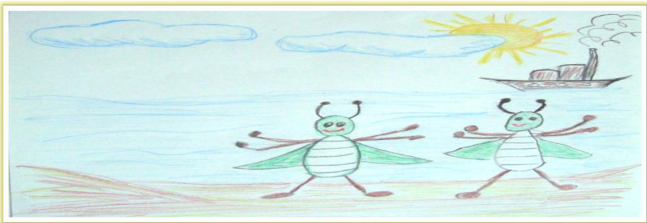
Γιάννης Νιφόρος (A2)