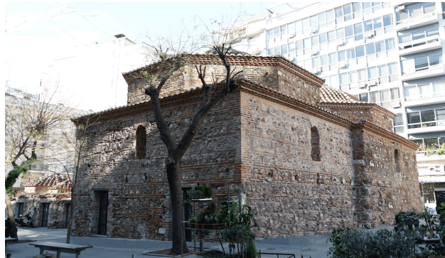
Γιαχουντί Χαμάμ - Λουλουδάδικα

Κτίστηκε στα τέλη του 1520 από τον διοικητή της Θεσσαλονίκης Τσεζερί Κασίμ Πασά, σε σημείο όπου προϋπήρχε Βυζαντινό λουτρό, αρχικά ως μονό λουτρό και αργότερα μετατράπηκε σε διπλό, με αντρικό και γυναικείο τμήμα.