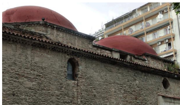
Γενί Χαμάμ (Αίγλη)

Το Γιαχουντί Χαμάμ βρίσκεται στη συμβολή των οδών Βασιλέως Ηρακλείου και Φραγγίνη στη Θεσσαλονίκη στην περιοχή Λουλουδάδικα.