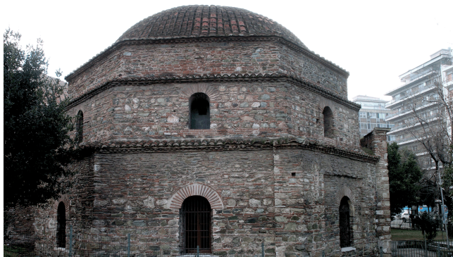
Λουτρά Παράδεισος - Μπέη Χαμάμ

Το Μπέη Χαμάμ βρίσκεται επί της οδού Εγνατία περίπου στο ύψος της οδού Αριστοτέλους. Χτίστηκε το 1444, 14 χρόνια μετά την κατάληψη της Θεσσαλονίκης από τον Μουράτ Β΄, πάνω σε απομεινάρια βυζαντινών εκκλησιών.