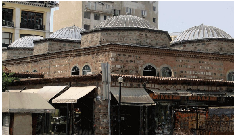
Σκεπαστή αγορά Μπεζεστένι

Το πιο χαρακτηριστικό κτίσμα του πρώτου αιώνα της τουρκοκρατίας, όπου είναι φανερή η τεχνική των βυζαντινών είναι η Σκεπαστή Αγορά ("Μπεζεστένι"), που βρίσκεται στη διασταύρωση των οδών Εγνατία και Βενιζέλου, σε ένα σημείο της παλιάς πόλης της Θεσσαλονίκης, που φαίνεται πως ανέκαθεν αποτελούσε το κέντρο του εμπορικού τομέα.