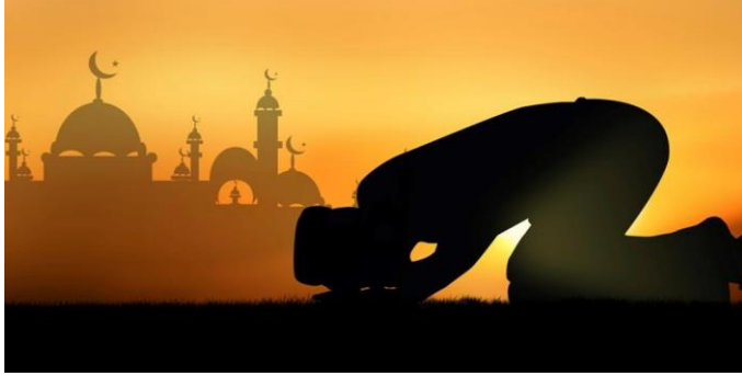
Εικόνα 2: Προσευχή στο τζαμί