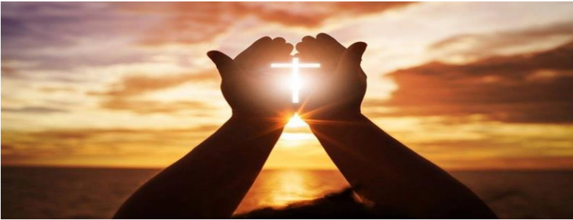
Εικόνα 1: Ο σταυρός, ένα ιερό χριστιανικό σύμβολο

Τρία είναι τα μεγάλα ιστορικά γεγονότα, που αναδεικνύουν την Εκκλησία της Θεσσαλονίκης στους έξι πρώτους αιώνες του χριστιανικού βίου της: Πρώτον η Παύλειος Παράδοση η οποία έχει τις ρίζες της στην ίδρυση από τον ίδιο τον Απ. Παύλο της Εκκλησίας της Θεσσαλονίκης, το 50 μ.Χ. Τους Χριστιανούς της πόλεως αυτής χαρακτηρίζει ο ίδιος ως «τύπους πάσι τοις πιστεύουσιν εν τη Μακεδονία και εν τη Αχαΐα (Α' Θεσ. 1,7), δεύτερον η Δημήτριος Παράδοση καθώς το μαρτύριο του Αγίου Δημητρίου, την 26 Οκτωβρίου του 305 μ.Χ. και η επακολουθήσασα τιμητική λατρεία δεν έχουν το όμοιό τους εις ιστορικό ρόλο σ' όλη την βυζαντινή αγιολογία και ιστορία. Η μεγάλη βασιλική του Αγίου και η πολυήμερη πανήγυρη του στη Θεσσαλονίκη, την καθιερώνουν ως το πρώτο πολιτιστικό κέντρο των Βαλκανίων, παράλληλο προς την έδρα της αυτοκρατορίας, την Κωνσταντινούπολη και τρίτον η διοικητική εξαρχική τιμή της στο σύστημα διοικήσεως του Αρχαιγόνου Χριστιανισμού, το τρίτο ιστορικό, διοικητικής σημασίας, γεγονός, που εξαίρει τη θέση της Εκκλησίας της Θεσσαλονίκης ως το 732 μ.Χ. Τί σημαίνει αυτό; Στην πρώτη Χριστιανική Εκκλησία, του 4 ου μ.Χ. αι., τέσσερις ήταν οι ανώτατες εκκλησιαστικές αρχές. Ονομάζονται Εξαρχίες. Ήταν της Ρώμης, της Αλεξάνδρειας και της Αντιοχείας ως το 325 μ.Χ. (Α' Οικ. Σύνοδος) και της Κωνσταντινουπόλεως το 381 μ.Χ. (Β' Οικ. Σύνοδος). Μετά από αυτές, διακεκριμένη θέση κατέχει και η Εκκλησία Θεσσαλονίκης ως Εξαρχία.