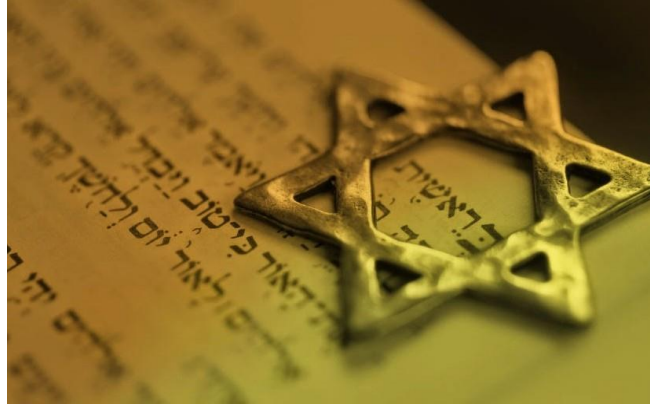
Εικόνα 3: Το αστέρι του Δαβίδ.