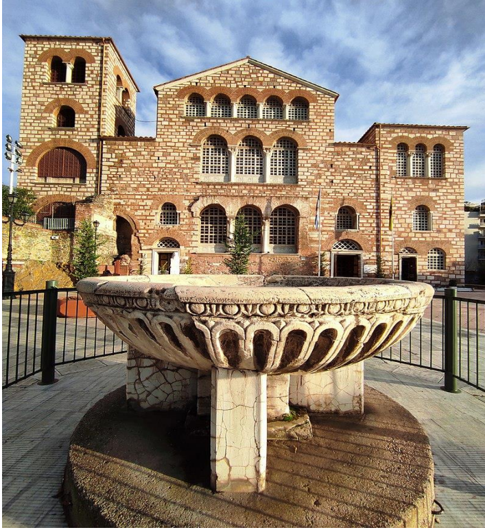
Εικόνα 4: Εκκλησία Αγίου Δημητρίου