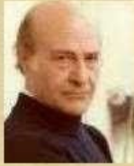
Ὀδυσσεύς Ἐλύτης 1911-1996 (Ποιητής, Νόμπελ 1979)

Εγὼ δὲν ξέρω νὰ ὑπάρχει παρὰ μία γλῶσσα, ἡ ἐνιαία γλῶσσα ἡ Ἑλληνική... Τὸ νὰ λέει ὁ Ἕλληνας ποιητὴς ἀκόμη σήμερα «οὐρανὸς» ἢ «θάλασσα» ἢ «ἥλιος» ἢ «σελήνη» ἢ «ἄνεμος», ὅπως τὸ ἔλεγαν ἡ Σαπφὼ καὶ ὁ Ἀρχίλοχος, δὲν εἶναι μικρὸ πρᾶγμα. Εἶναι πολὺ σπουδαῖο. Ἐπικοινωνοῦμε κάθε στιγμή μιλώντας μετὰ τὶς ρίζες μας. Τὶς ρίζες μας ποὺ βρίσκονται ἐκεῖ: στὰ Ἀρχαῖα.