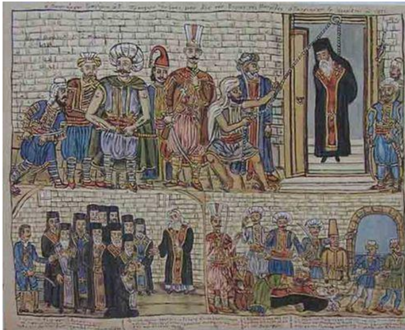
Χατζημιχαήλ Θεόφιλος -Ο απαγχονισμός του πατριάρχη Γρηγορίου του Ε' paletaart - Χρώμα & Φώς - WordPress.com