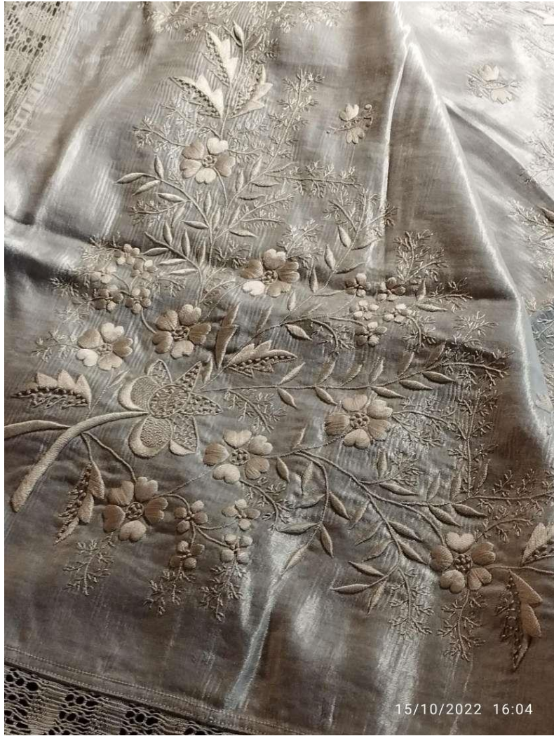
Νέστορας Τζιμπιμπάκης Α΄3