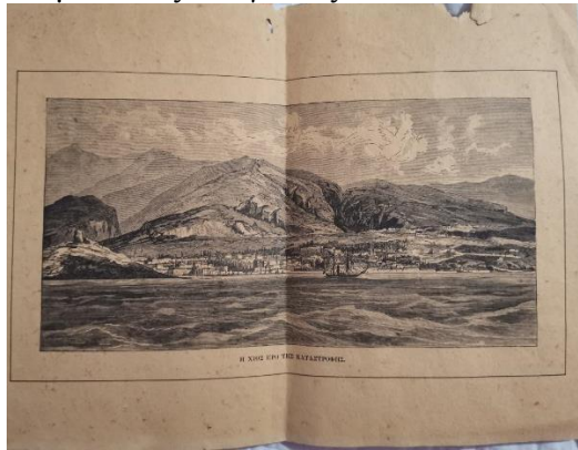
Χίος - Φωτογραφία από το αρχείο της Ευγενίας Η. Σκηνίτη

Οι Οινούσσες είναι ένα σύμπλεγμα νησιών του Βόρειου Αιγαίου και βρίσκεται 2 χλμ βορειοανατολικά της Χίου και 8 χλμ από τα παράλια της Τουρκίας. Η γιαγιά μου Ευγενία Η. Σκηνίτη κατάγεται από τις Οινούσσες. Η οικογένεια της δεν είχε ρίζες από τη Μικρά Ασία όμως μεγάλωσε με παιδιά Μικρασιατών και οι ιστορίες των προγόνων τους ήταν γνωστές ανάμεσα στις οικογένειες.